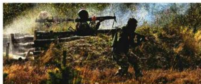
'Rat na istoku Ukrajine u nizu aspekata podsjeća na model srpske agresije na Hrvatsku 1991.', objasnio je u Kijevu Plenković i ponudio pomoć Hrvatske