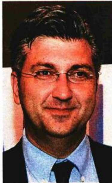
ANDREJ PLENKOVIĆ (HDZ)

Eurozastupnici iz HDZ-a u raspravi o Srbiji ponašali su se nespretno. No, uvjeren sam da će postignuti kompromis dati rezultate jer se ne može jedna kandidatska zemlja blokirati na takav način.