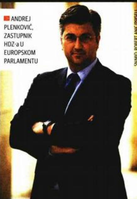
ANDREJ PLENKOVIĆ, ZASTUPNIK HDZ-a U EUROPSKOM PARLAMENTU

Hrvatska, zasad, pripada onoj skupini zemalja EU koju "štiti" tzv. pravilo Dublin III, po kojem bi izbjeglice trebala primiti ona zemlja EU na čiji je