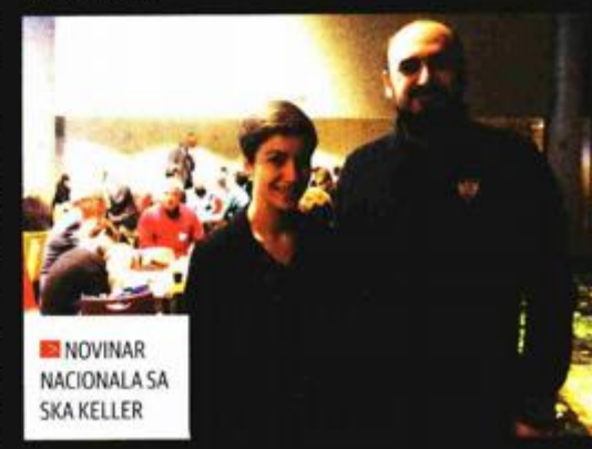
NOVINAR NACIONALA SA SKA KELLER