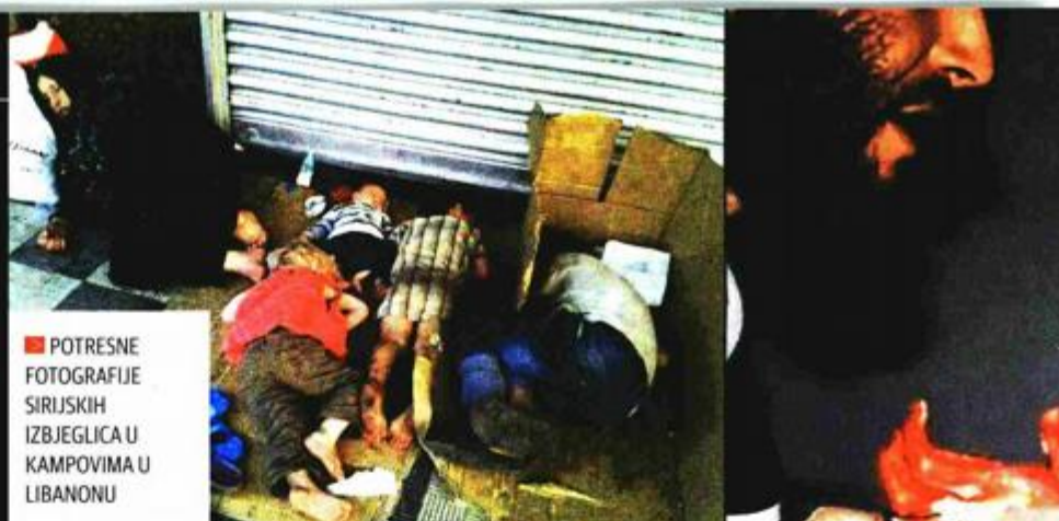
POTRESNE FOTOGRAFIJE SIRIJSKIH IZBJEGLICA U KAMPOVIMA U LIBANONU

Povjerenik EU za migracije, unutarnje poslove i državljanstvo Dimitris Avramopoulos izjavio je da Komisija namjerava predložiti raspoređivanje izbjeglica prema kombiniranom kriteriju broja stanovnika neke zemlje i njene ekonomske snage: "Nije u redu da zemlje koje primaju najviše kontingentskih izbjeglica ujedno dobivaju i najveći broj tražitelja